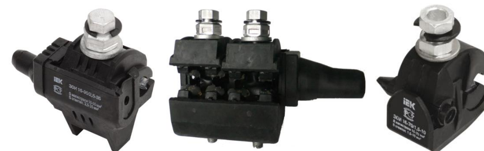
Рисунок 4 Прокалывающие изолированные зажимы ЗОИ

Убирает рабочее место, собирает инструмент, приспособления, такелаж, защитные средства и грузит в автомобиль.