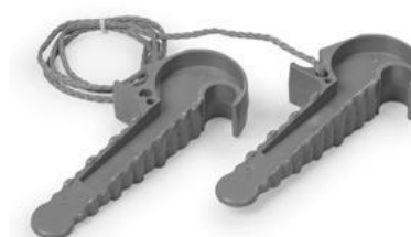
Рисунок 2 Отделительные клинья

Переносное заземление на рабочем месте разрешается присоединять к заземлителю, погруженному вертикально в грунт, не менее чем на 0,5 м. Запрещена установка заземлителей в случайные навалы грунта.(ПОТЭУ 22.8).