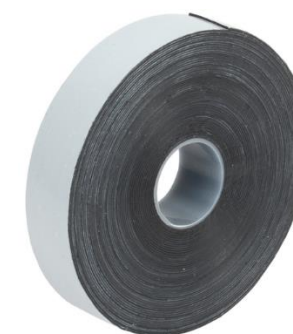
Рисунок 3 Лента самоспекающаяся СП 0,76 x 19