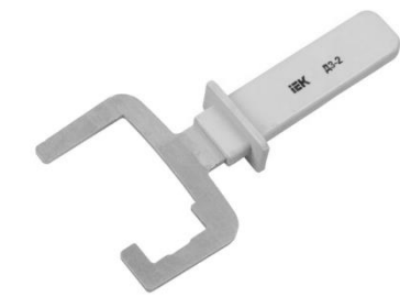
ДЗ-1 ДЗ-2 Рисунок 6 Держатели зажимов

Предназначены для удержания прокалывающих зажимов за нижнюю планку при установке. Изолированная ручка позволяет применять держатель при работе под напряжением.