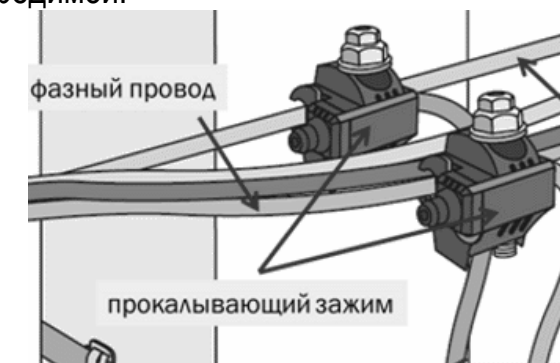
Рисунок 5 Подключение к ВЛИ прокалывающими зажимами

Прокалывающие зажимы надеваются на провод и затягиваются через срывную верхнюю головку болта. Она дает определенное усилие прижатия зубцов к проводу, чтобы обеспечить электрический контакт и при этом не повредить его. В дальнейшем зажим можно снять гаечным ключом, отвернув нижнюю головку демонтажа, которая остается невредимой.